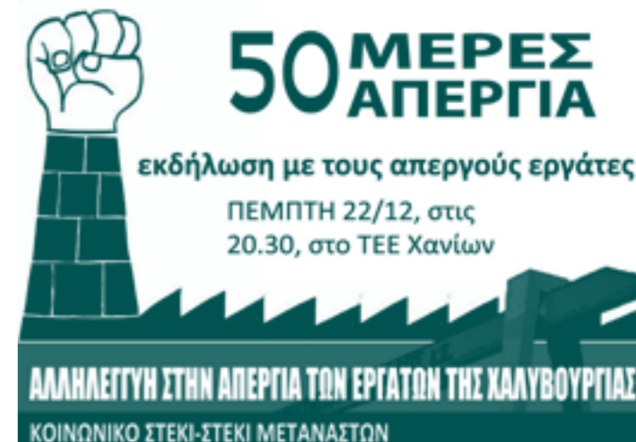
Affiche appelant à un événement de solidarité avec les grévistes, le 22 décembre 2011, organisé en Crète par un centre social et un centre d'immigrés.

L'austérité frappe aussi en dehors de la zone Euro :