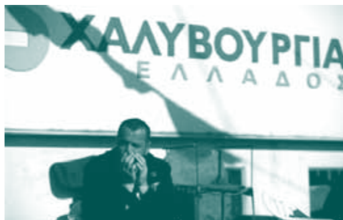
Gréviste devant la porte des "Aciéries grecques"

Cette règle s'applique aussi à la fiscalité : dans tous les pays de l'Union, les plus riches, les rentiers et les multinationales ont bénéficié, depuis 20 ans, d'importantes diminutions d'impôts : la concurrence fiscale (voir les grandes fortunes françaises qui se domicilient en Belgique...) est utilisée comme justification de ces politiques à la Reynders, qui ont largement creusé les déficits publics et fait grimper les dettes.