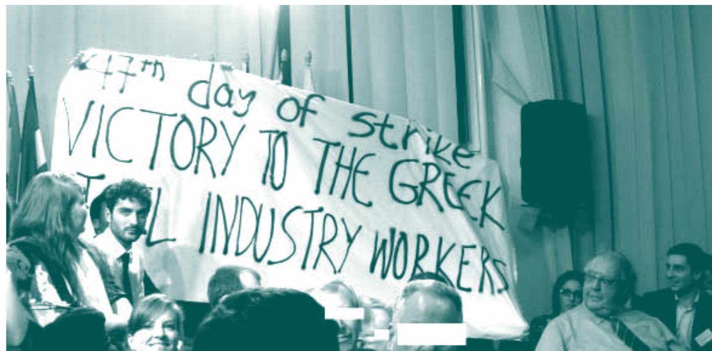
Incursion d'activistes grecs dans un studio de télé où le vice-premier ministre Pagkalos intervenait. Slogan : "47 ième jour de grève : victoire des métallurgistes grecs".

La crise actuelle du capitalisme est sans doute globale. Les crises bancaires ou financières ne sont que les parties visibles de l'iceberg. La crise que nous vivons exprime les difficultés, les contradictions entre :