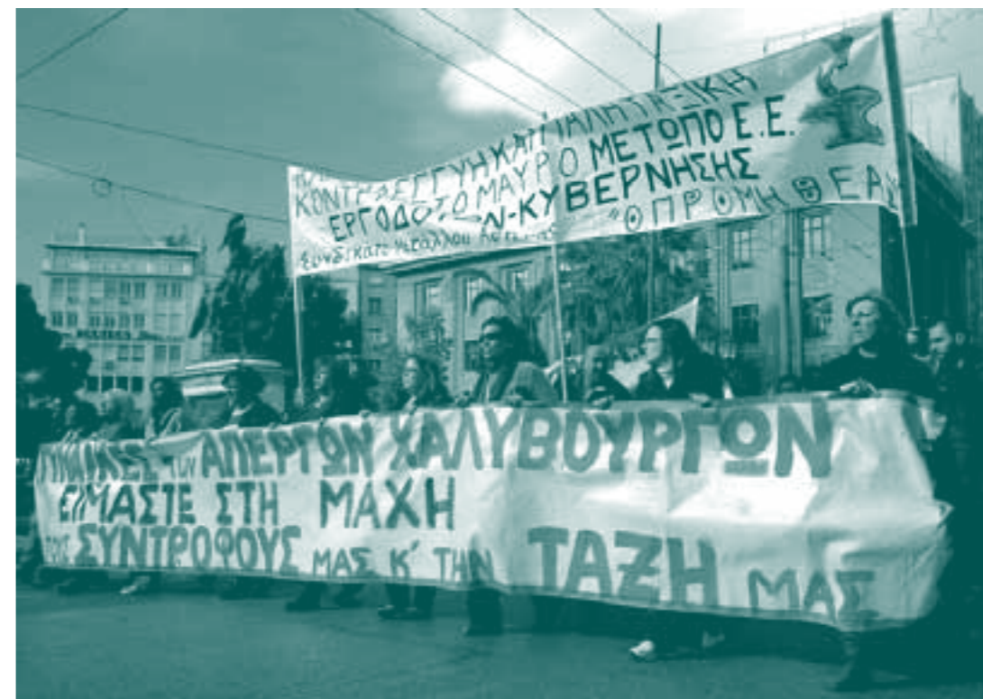
En Grèce les femmes des métallurgistes en grève. Slogan : "Nous sommes dans le combat avec nos compagnons et notre classe".

Deux tiers des membres de ces groupes viennent de l'industrie. On ne compte que quelques parlementaires et aucune association de défense des libertés ou de la vie privée. Les traités de l'UE n'offrent aucune base juridique à ce type de forums, raison pour laquelle il a été créé sous la forme d'un groupe informel bien que la Commission y joue un rôle moteur.