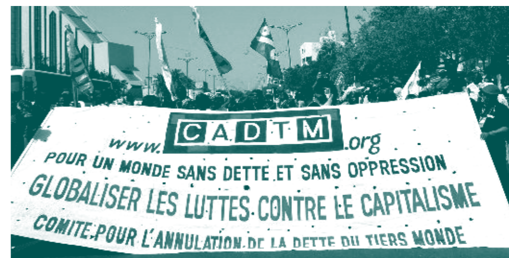
Le CADTM au Forum social mondial de Dakar en 2011